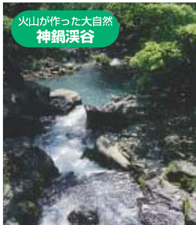
火山が作った大自然 神鍋溪谷