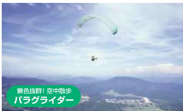
景色抜群！空中散歩 パラグライダー

約2万年前に噴火したと推測される、標高469.5mの神鍋山。壮大な噴火口の周辺をぐるりとハイキングしてみよう！