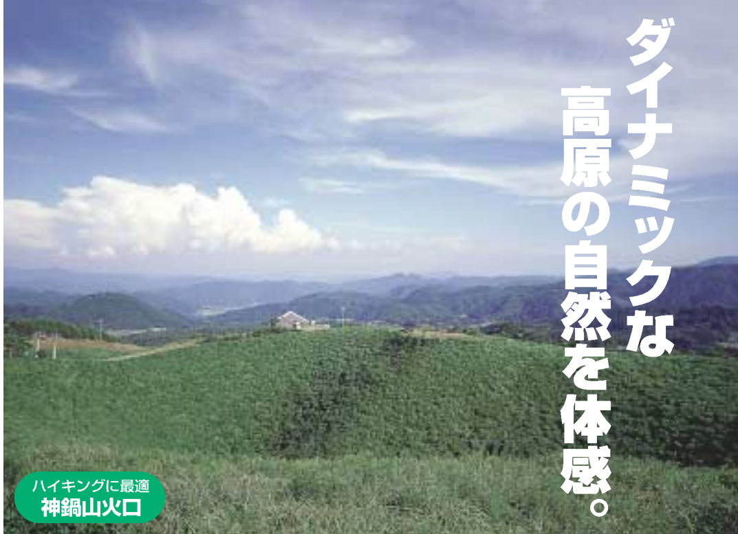
ハイキングに最適 神鍋山火口