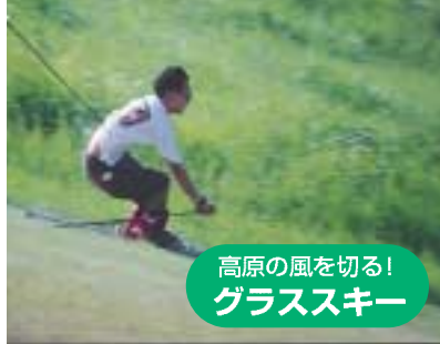
高原の風を切る！ グラススキー